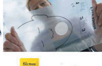
Folije za umjetno disanje