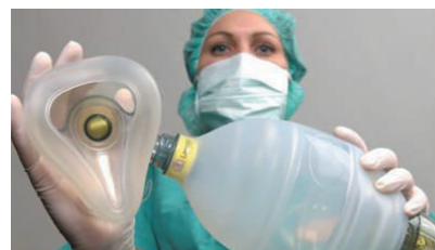
Balon za reanimaciju