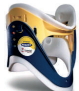
Okovratnik za odrasle, podesiv u 4 veličine