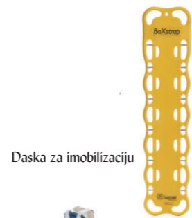
Daska za imobilizaciju