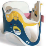
Okovratnik za djecu, podesiv u 3 veličine